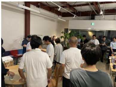
＜9月に先行実施した現地紹介ツアーの様子＞

新潟県三条市の複合交流拠点「三-Me.」は、一般社団法人燕三条空き家活用プロジェクトによる空き家活用の第一号案件として、2023年2月にオープンしました。本物件は、住宅部が約16年間、店舗部が約3年間空き家状態（※2023年時点）になっており、当社の空き家事業「アキサポ」（ https://www.akisapo.jp/ ）のスキームを応用して、地域交流の拠点として再生した物件です。再生にあたって、ジェクトワンでは空き家地域課題解決事業の一環として、本物件の活用における業務支援をしています。