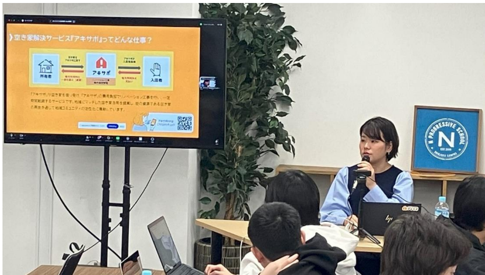
「プロジェクト N」の第 1 回目で講演する空き家プランナー

不動産の開発事業・リノベーション事業および空き家事業を展開する株式会社ジェクトワン（以下、ジェクトワン）は、学校法人角川ドワンゴ学園 N 中等部（以下、N 中等部）の課題解決型プロジェクト学習（PBL = Project Based Learning）「プロジェクト N」で行われた「空き家活用プロジェクト」に協力し、当社空き家プランナーが講師として登壇したことをお知らせいたします。