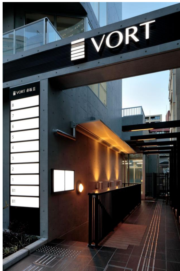
外観（地下店舗動線）

地下1階と1階は店舗利用、2階から8階はオフィス利用をターゲットとし、1階のエントランス部分には大きな門型の構えと、植栽による彩りを加えることで、赤坂エリアに相応しい先進性と風格を持つシンボリックな建物デザインとしています。